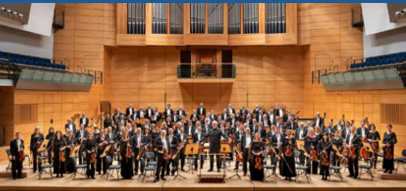
Die Staatskapelle Halle in der Georg-Friedrich-Händel HALLE