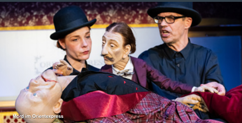
Mord im Orientexpress